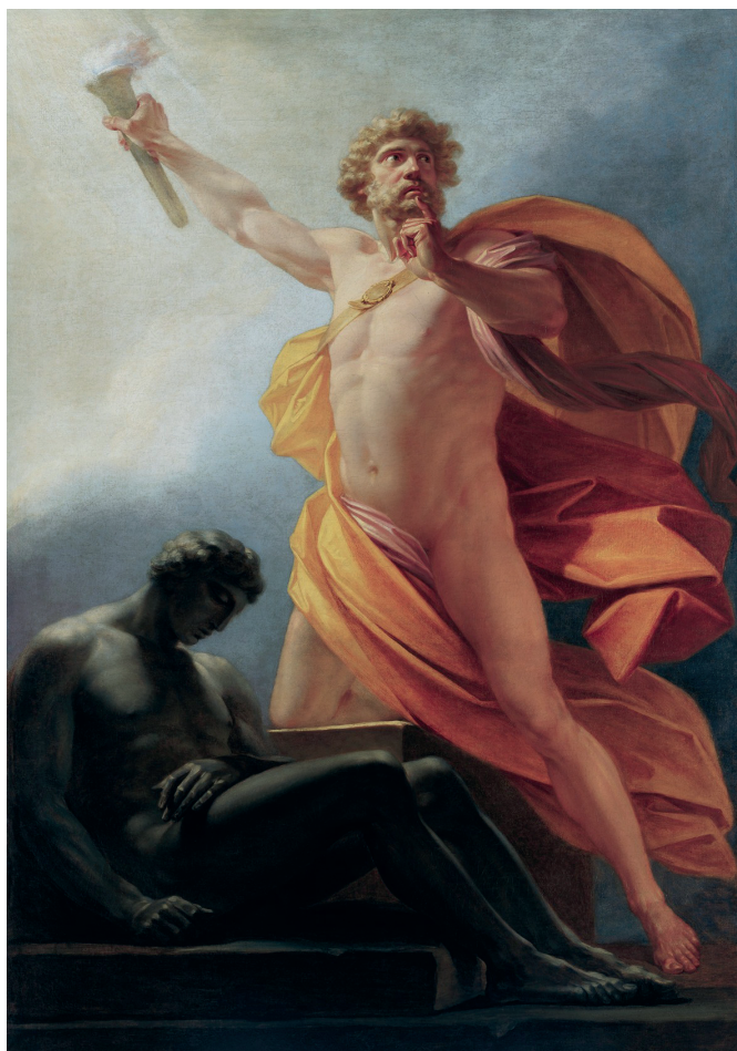
Prometheus bringt den Menschen das Feuer, 1817, Heinrich von Füger, Sammlungen des Fürsten von und zu Liechtenstein

nehmenswerte, die von einer Auswahl an Menschen definiert und auf Hochglanzbrochüren gedruckt werden, sind meist wirkungsschwach. Die Mitarbeitenden können sie nur beschränkt übernehmen und in der Tiefe erfassen. Durch die Arbeit an den inneren Persönlichkeitsebenen werden die individuellen Werte direkt und positiv angeregt und entfaltet.