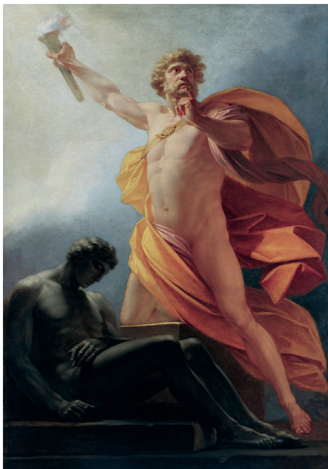
Prometheus bringt den Menschen das Feuer, 1817, Heinrich von Füger, Sammlungen des Fürsten von und zu Liechtenstein

nehmenswerte, die von einer Auswahl an Menschen definiert und auf Hochglanzbrochüren gedruckt werden, sind meist wirkungsschwach. Die Mitarbeitenden können sie nur beschränkt übernehmen und in der Tiefe erfassen. Durch die Arbeit an den inneren Persönlichkeitsebenen werden die individuellen Werte direkt und positiv angeregt und entfaltet.